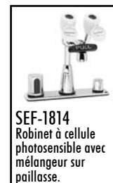
SEF-1814 Robinet à cellule photosensible avec mélangeur sur paillasse.