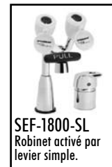
SEF-1800-SL Robinet activé par levier simple.